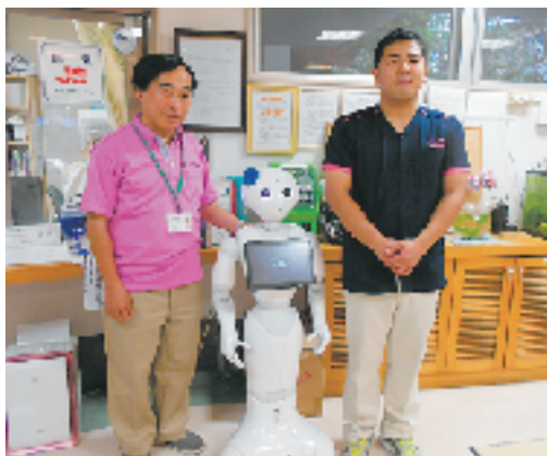
ユニフォームが新しくなりました