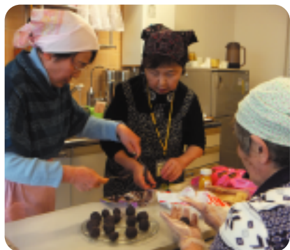
このような活動がまたできますように

今年度は早々に新型コロナウイルス感染拡大防止のため、「非常事態宣言」が発出され、ボランティアの皆様には活動